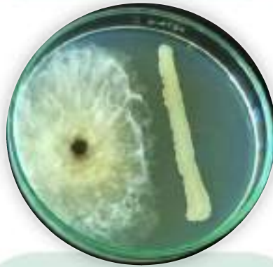
Bacillus sp. controlando a Neofusicoccum