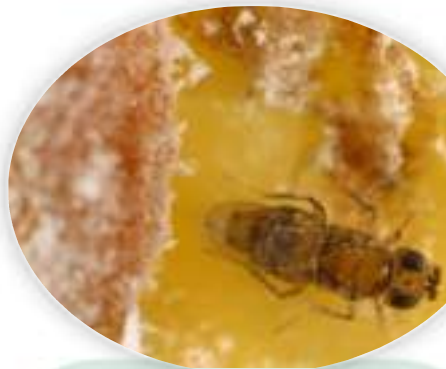
Ejemplar de Acerophagus , controlador del chanchito de la vid