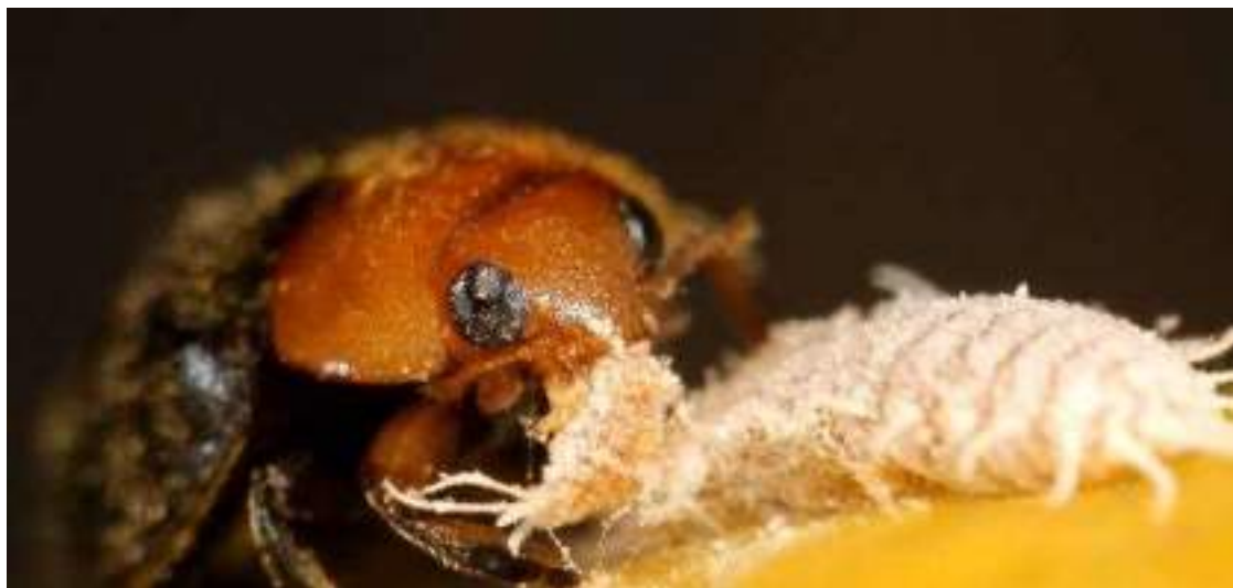
Cryptolaemus montrouzieri depredando al chanchito blanco.

Y el fenómeno está llegando también a las grandes transnacionales de agroquímicos que suman este tipo de controladores a su oferta.