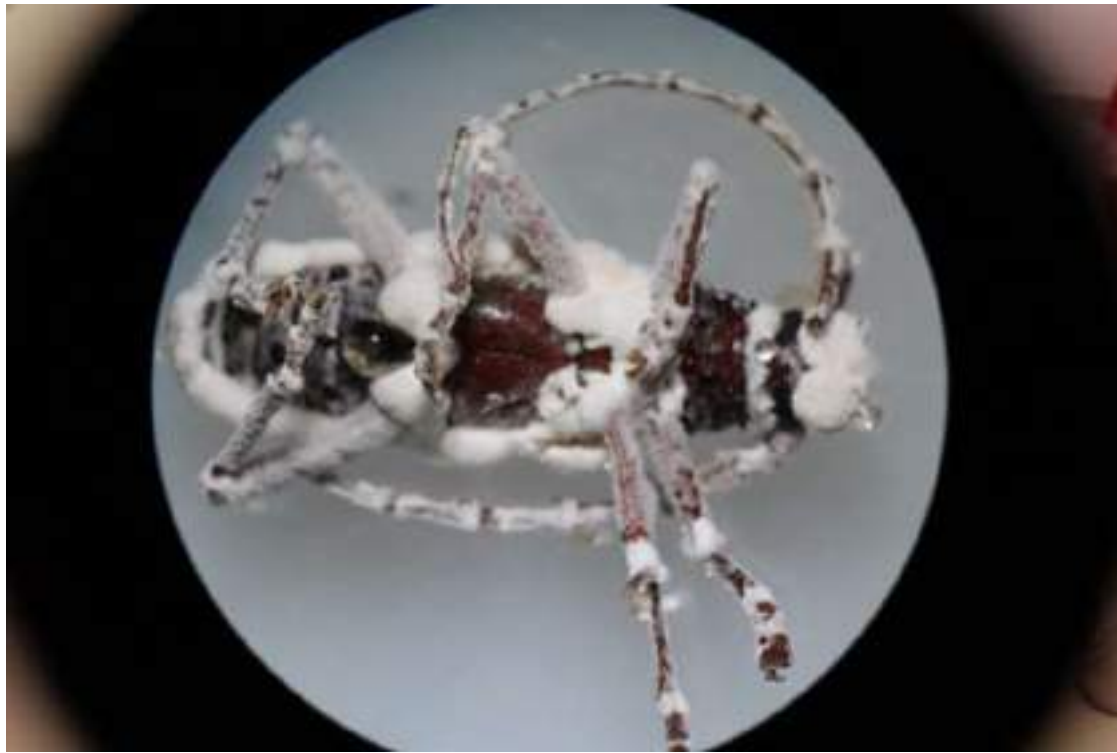
Insecto parasitado con hongos entomopatógenos.

Considerando esta realidad, los especialistas creen que las evaluaciones de la efectividad de los controladores no deben realizarse a corto plazo y es necesario darles un tiempo para que puedan funcionar.