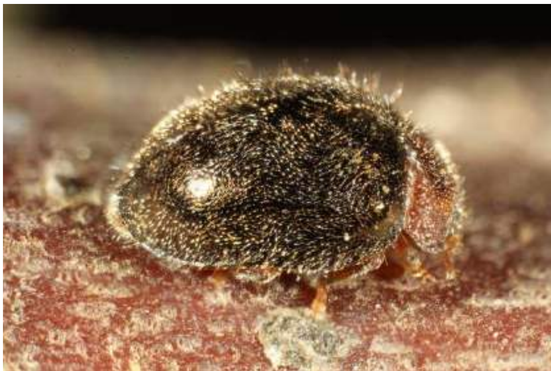
Depredador de escamas púrpura ( Rhyzobius lophanthae ) controlando a la Escama San José ( Diaspidiotus perniciosus ) en cerezo.

Por su parte, INIA, a través de su Centro Tecnológico de Control Biológico (CTCB),