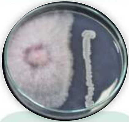
Bacillus sp. controlando a Fusarium