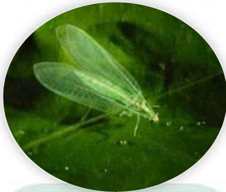
Ejemplar de Chrysoperla (crisopa verde)